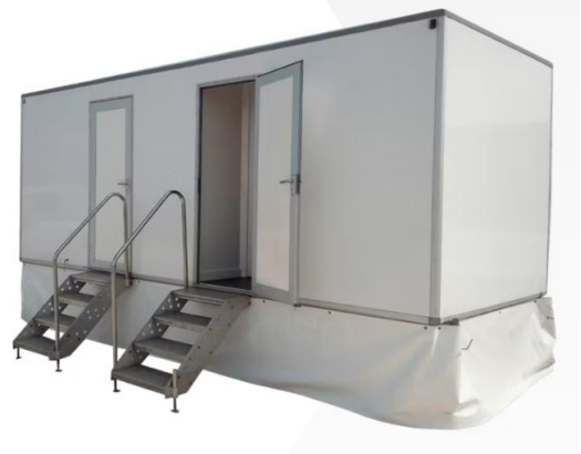
Atrrelado WC Premium 3+1 (deposito)