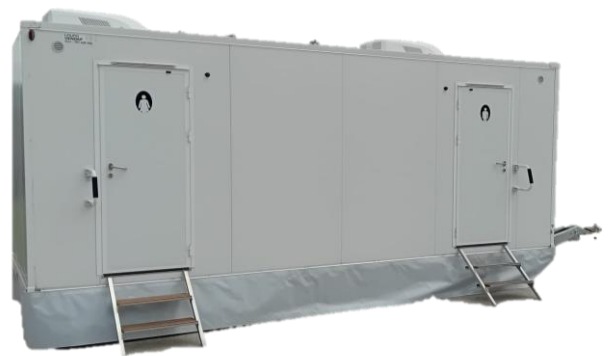
Atrrelado WC Premium 3+1 (deposito/rede)