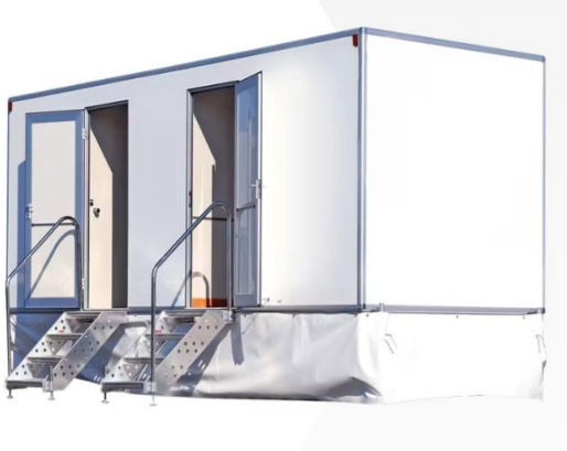
Atrrelado WC Premium 2+1 (deposito)