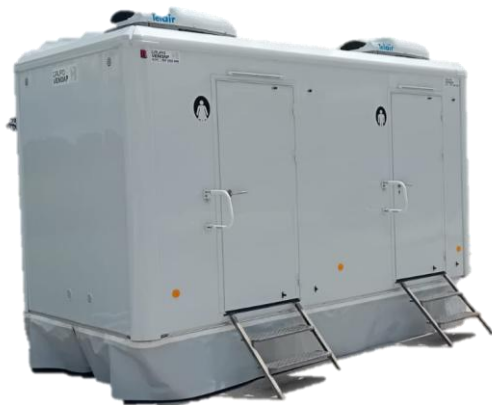
Atrrelado WC Premium 2+1 (deposito/rede)