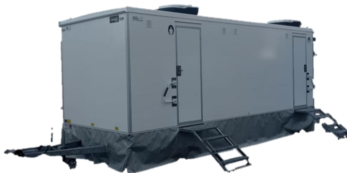
Atrrelado WC Premium 4+1 (deposito/rede)