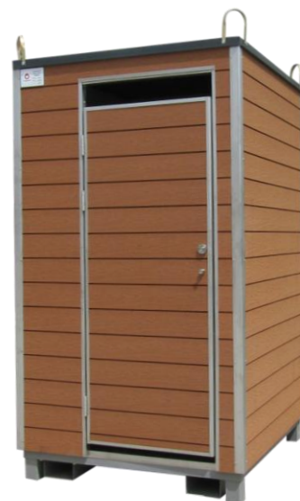
Sanitário VIP Plus