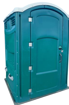
Sanitário VIP Mobilidade Condicionada