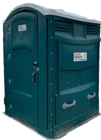
Sanitário Standard Mobilidade Condicionada